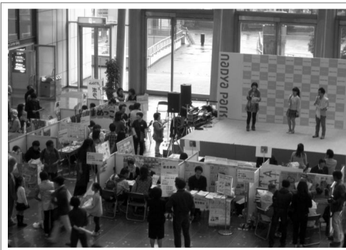
NPOブース出展&ステージイベント

あいにくの雨ではありましたが、総勢約1500人の方にお越しいただき、各会場とも盛況でした!