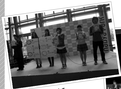
学生ボランティアによる「チャリティ・プログラム」説明