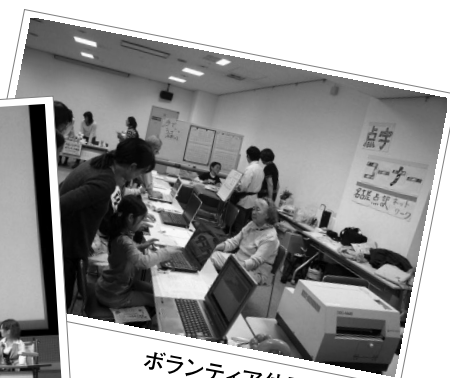
ボランティア体験コーナー